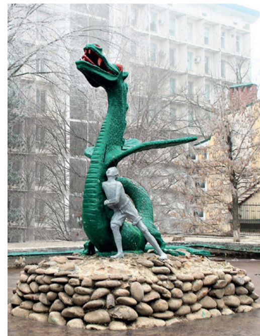
Мальчик и дракон. Элиста

Название небольшого живописного ущелья Кала-Кулак переводится с балкарского как «ущелье башен». А среди туристов именуется Зубами Дракона. Так назы-