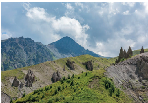
Зубы Дракона в Джилы-Су

На выезде из села Александровского Ставропольского края расположен камень, который по своей форме напоминает дракона. Его длина одиннадцать метров, высота — четыре. По легенде, в здешних краях был