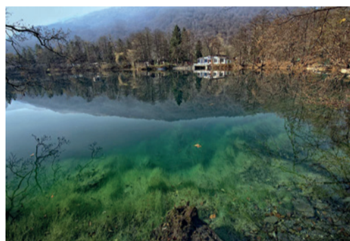
Нижнее Голубое озеро

Еще одно драконье местечко — нижнее Голубое озеро в Кабардино-Балкарии. Определить его глубину пытался сам Жак-Ив Кусто. Церик-Кель считается самым глубоким карстовым озером в России. По местной легенде, на его дне лежит и плачет дракон, которого ранил сказочный богатырь. Горькие слезы