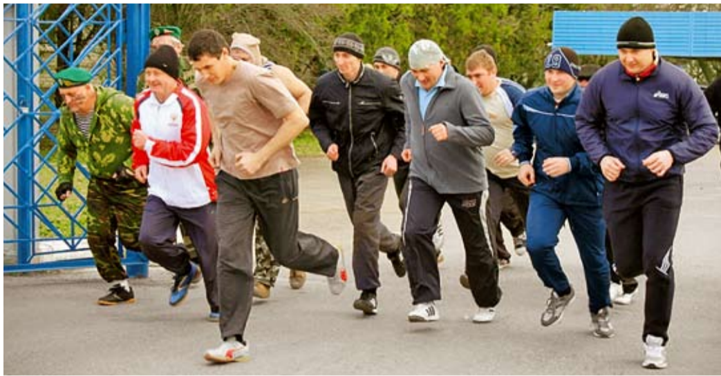
Легкоатлетический кросс в Привольненском ЛПУ МГ

Газовики – активные участники многих спортивных соревнований, проходящих в зоне ответственности предприятия. В марте работники Общества покорили несколько новых вершин спортивного олимпа.