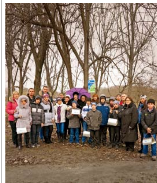
Участники акции «Новый дом для птиц»