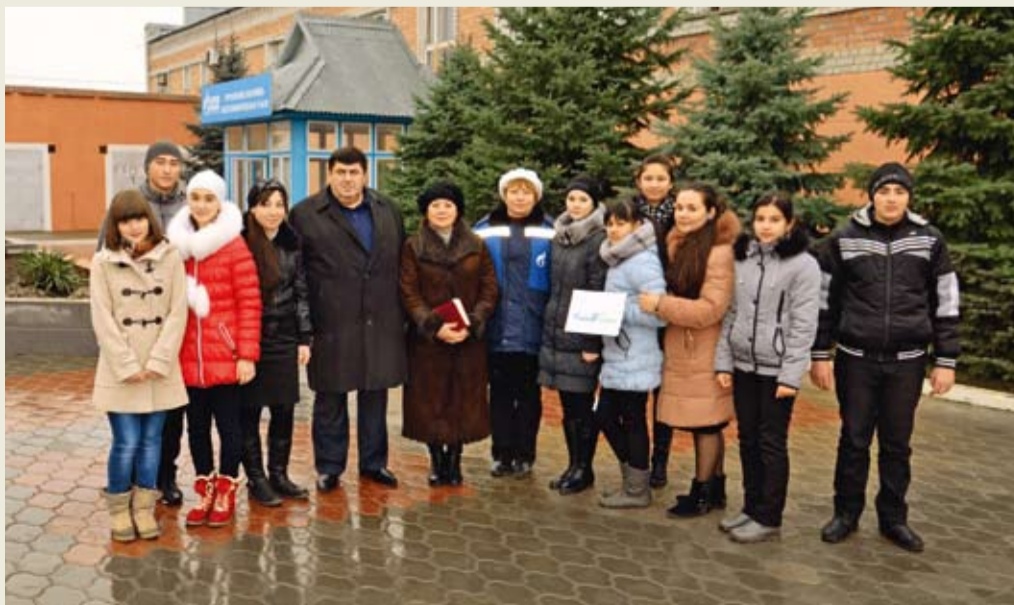
Участники экологического проекта «Живой родник»