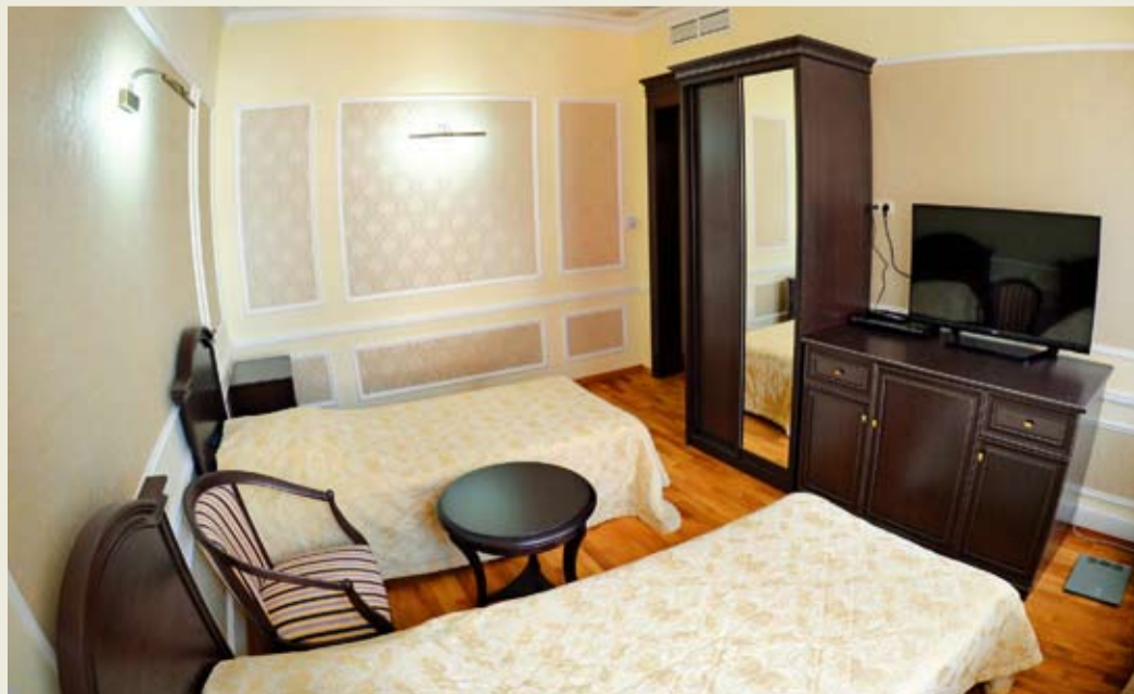
Интерьер двухместного номера