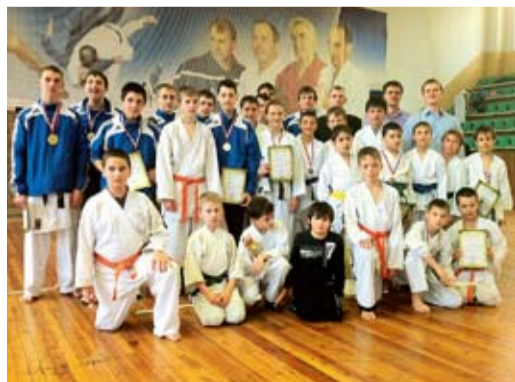
Каратисты Общества в Адыгее