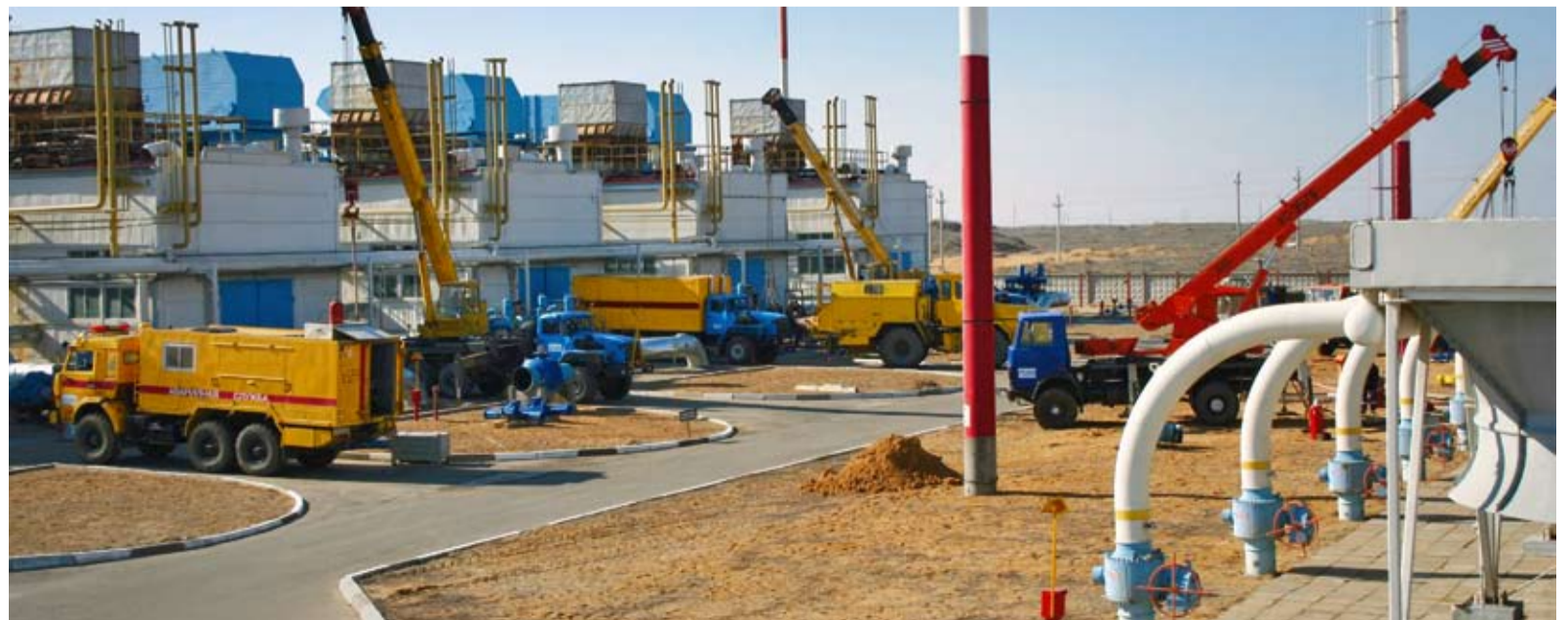
Место проведения огневых работ