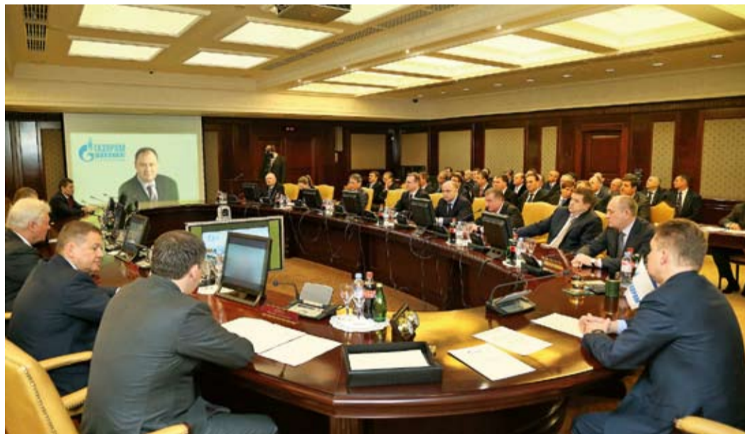
Праздничное селекторное совещание