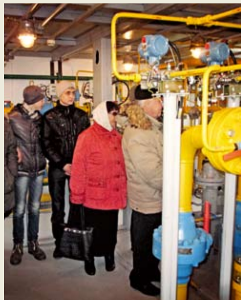
Экскурсия на ГРС «Сухая Буйвола»