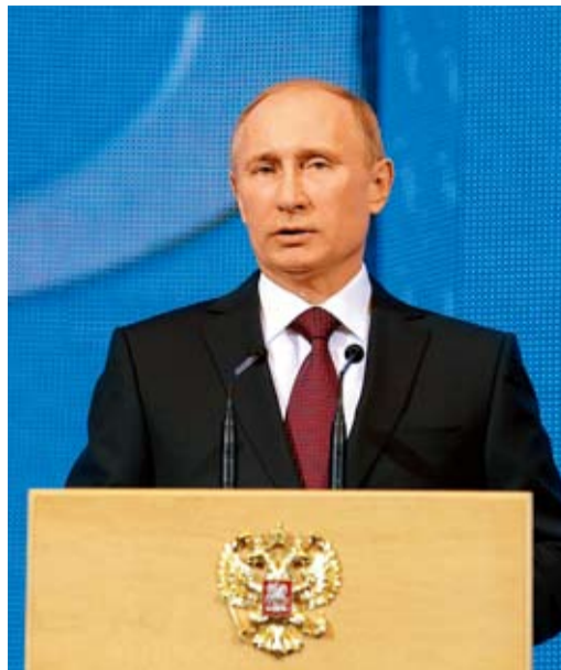
Владимир Путин поздравляет газ-виков