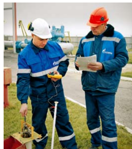
Практическое задание специалистов службы ЭХЗ