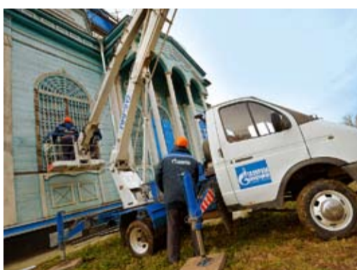
Газовики меняют окна в храме

зывали, что когда-то в церкви было одиннадцать колоколов, звон от которых разносился на многие километры вокруг, поэтому сюда на службу всегда приходили люди из соседних деревень, хуторов и сел.