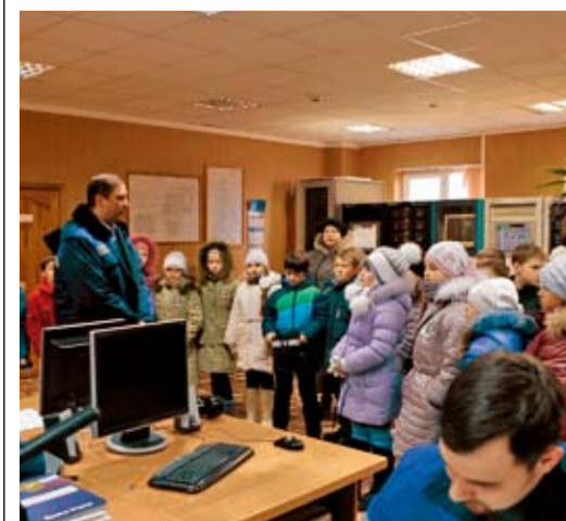
Школьники на ДКС-1 Ставропольского ЛПУ МГ