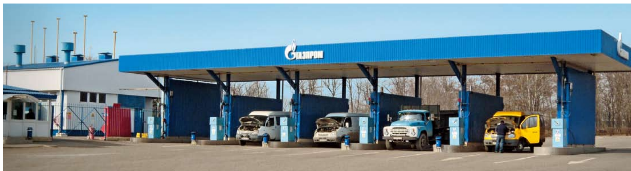
Автомобильная газонаполнительная компрессорная станция г. Пятигорска