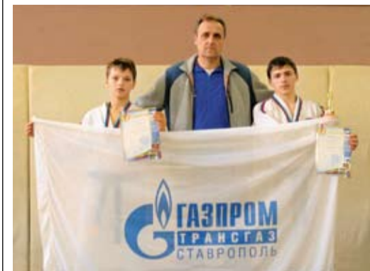
Дзюдоисты на соревнованиях в КЧР