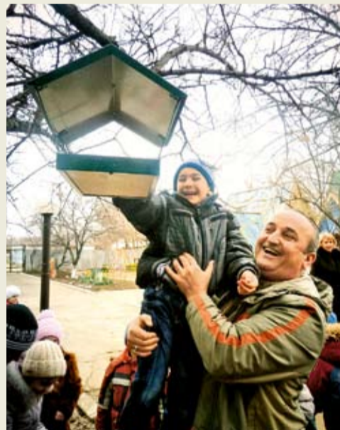
Мероприятие в Светлоградском ЛПУ МГ