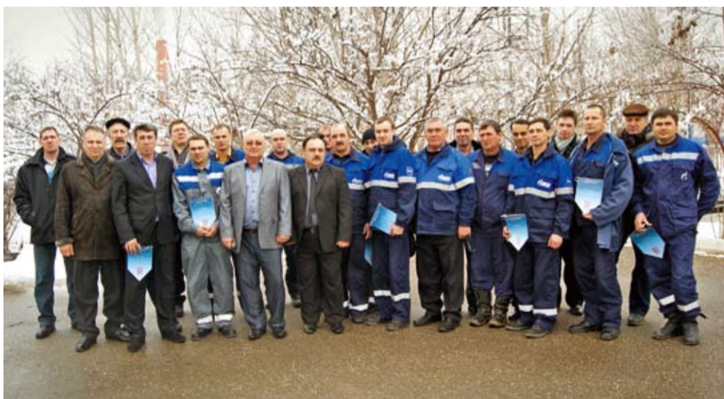
Участники конкурса «Лучший по профессии»