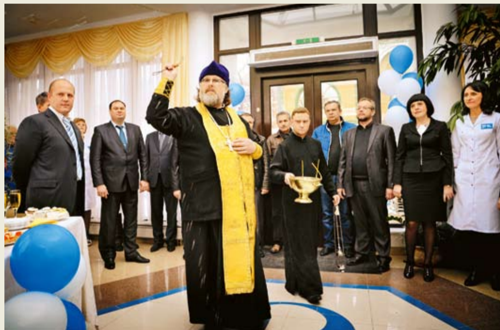
Освящение нового корпуса