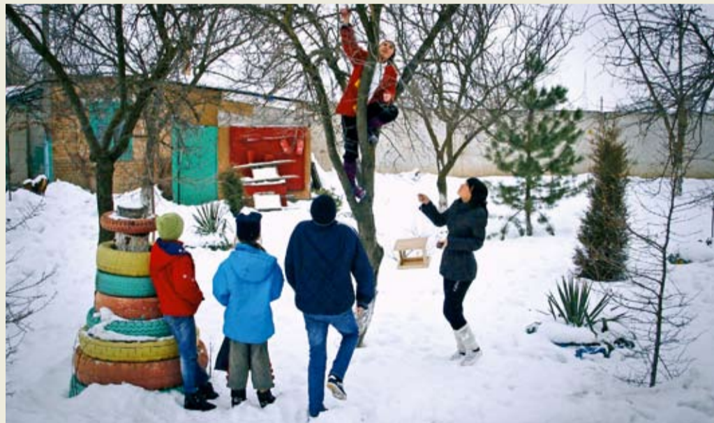
Экологическая акция в Моздокском ЛПУ МГ

В филиалах ООО «Газпром трансгаз Ставрополь» проходят природоохранные мероприятия, запланированные в Год экологии. В феврале состоялась несколько экскурсий для школьников на производственные объекты Общества, успешно прошли экологические акции по защите птиц, стартовал проект «Живой родник» по исследованию водных источников села Кангли Минераловодского района Ставропольского края.