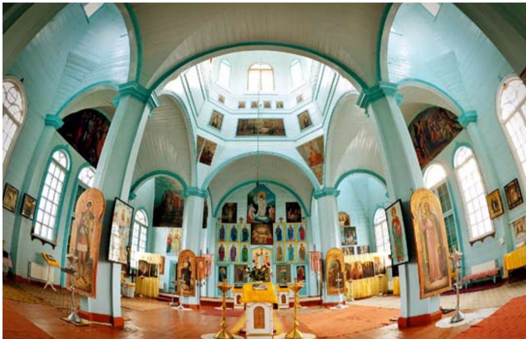
Храм Рождества Пресвятой Богородицы в станице Рождественской

– Церковь Рождества Пресвятой Богородицы – уникальное сооружение, занесенное сегодня в список исторических памятников Ставропольского края, – рассказывает отец Андрей. – Когда я впервые увидел ее в ноябре 2011 года, не поверил глазам: огромный храм, необыкновенный по своему архитектурному исполнению! Удивительно, как в XIX веке без специальной техники смогли установить такие большие окна, выставить леса, живописно расписать стены. Старожилы расска-