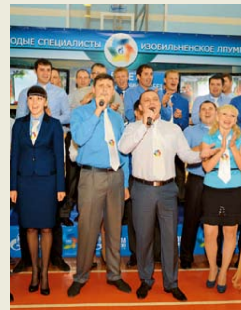
Выступает молодежь Изобильненского ЛПУ МГ