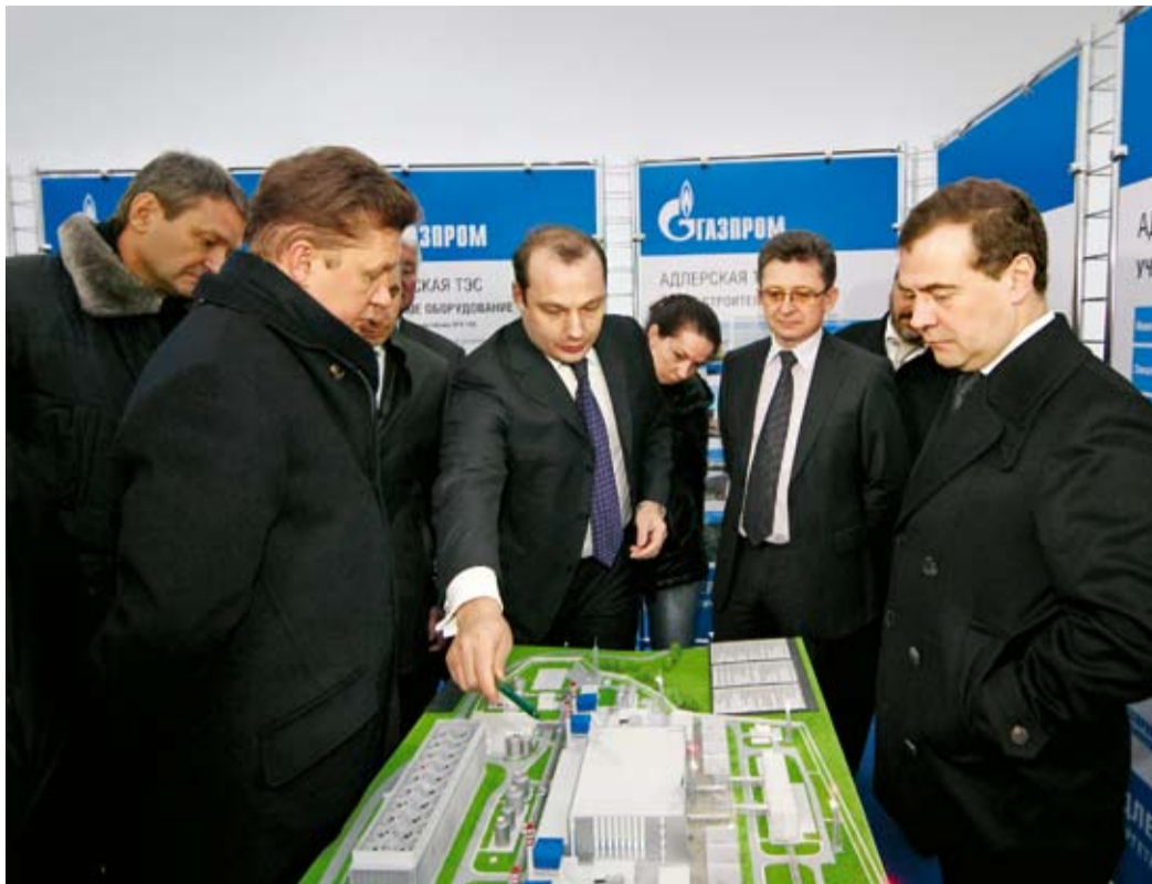
Алексей Миллер и Дмитрий Медведев на Адлерской тепловой электростанции

Газпром продолжает последовательно двигаться к достижению стратегической цели в электроэнергетике – довести показатели эффективности до уровня крупнейших ми-