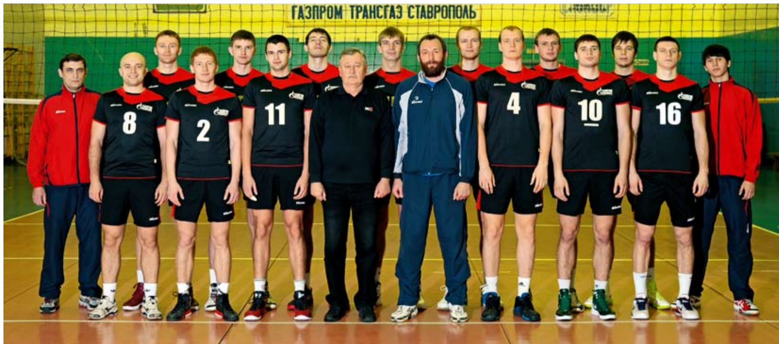
Волейбольный клуб «Газпром трансгаз Ставрополь»

– Команда в этом году подобралась крепкая, вариативная, сплоченная. Хорошо играем на блоке, неплохо справляемся с первым темпом, доигровкой, подачей, – отмеча-