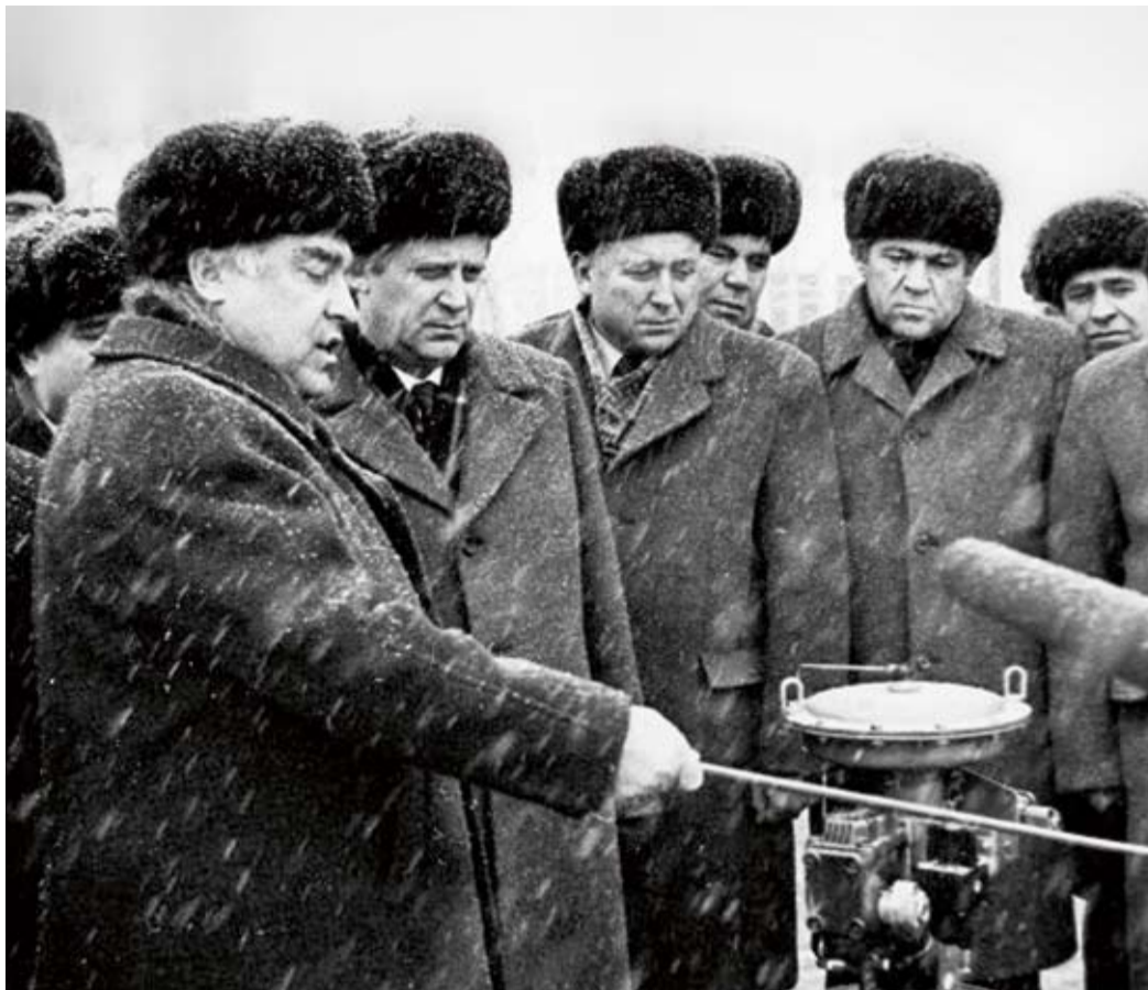
В. Черномырдин демонстрирует оборудование Председателю Совмина СССР Н. Рыжкову, 1980-е годы

В 1972 году генеральный секретарь Центрального Комитета Коммунистической партии Советского Союза Леонид Брежнев и канцлер Федеративной Республики Германия Вилли Брандт заключили соглашение «Газ – трубы», позволяющее экспортировать советский газ в Западную Европу.