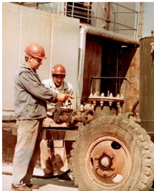
Из архива Георгиевского ЛПУ МГ. КС-8, 1990-е годы