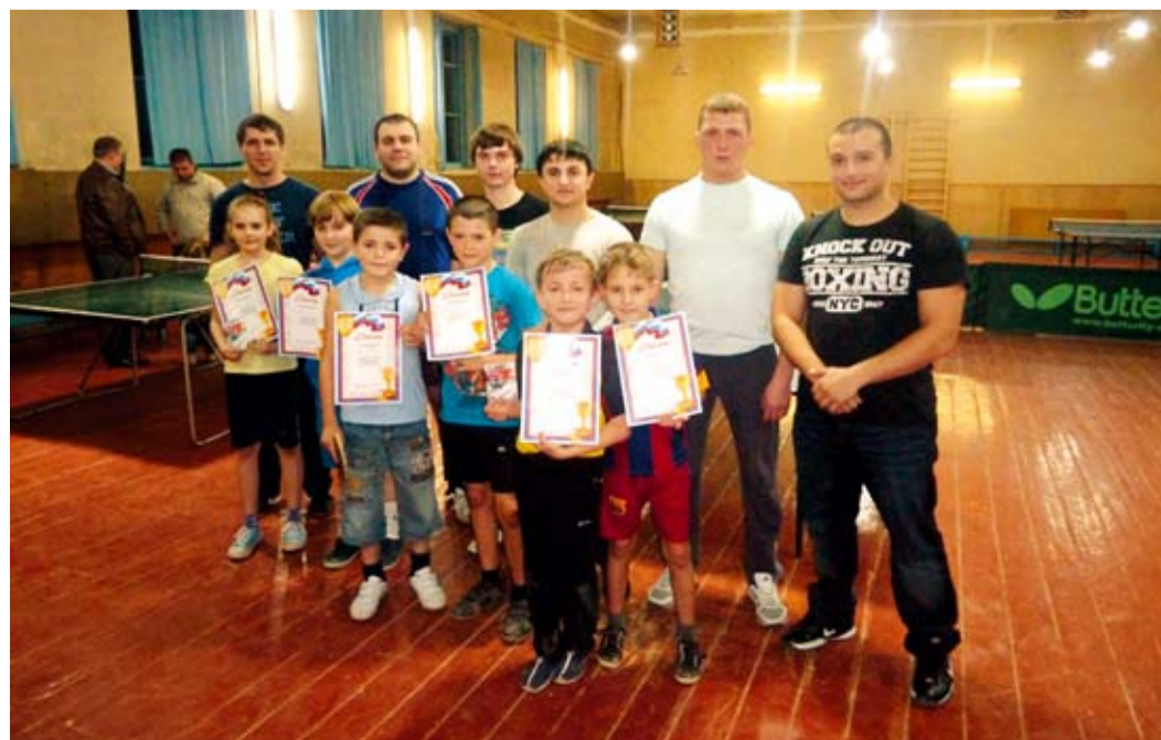
Победители и призеры турнира по настольному теннису