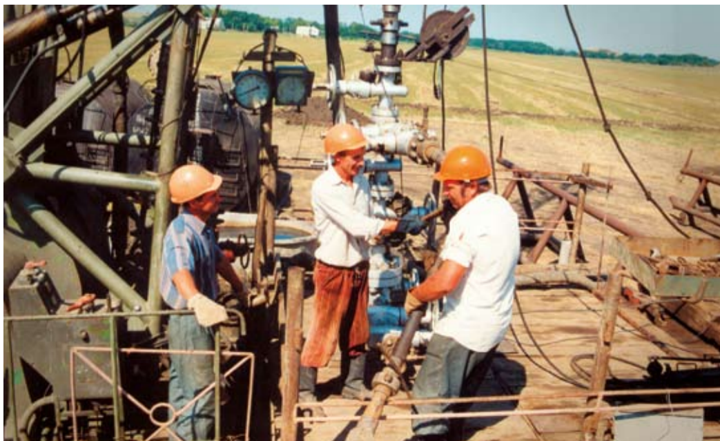
Из архива Ставропольского ЛПУ МГ. ЦКРС в 1990-е годы