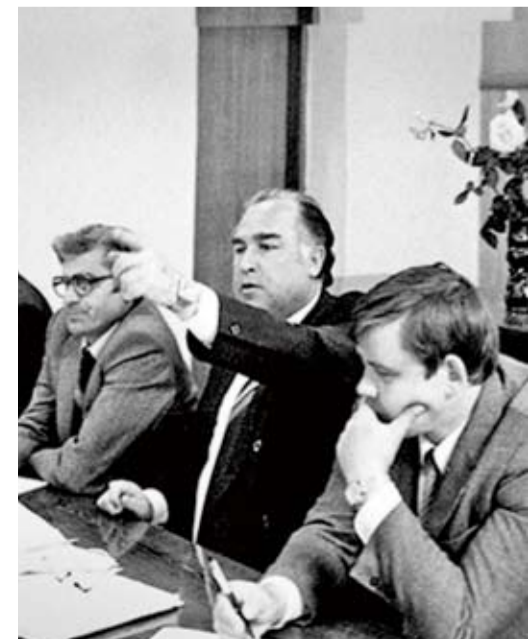
На совещании в «Тюменьтрансгазе», 1980-е годы