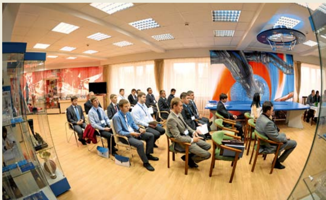
На секции «Эксплуатация ГРС. Ремонт оборудования» конференции молодых специалистов Общества