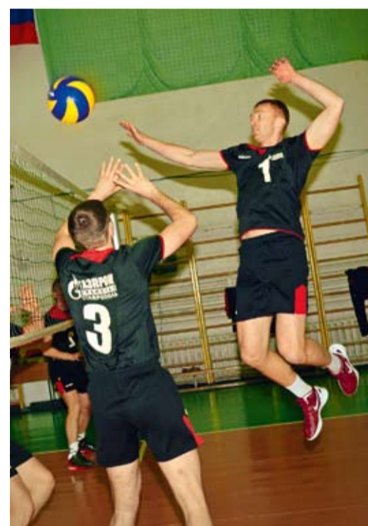
Во время игры