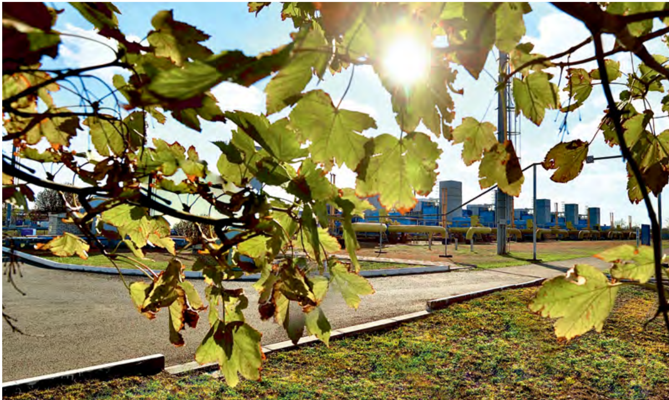
Осень на КС-6 «Изобильный»