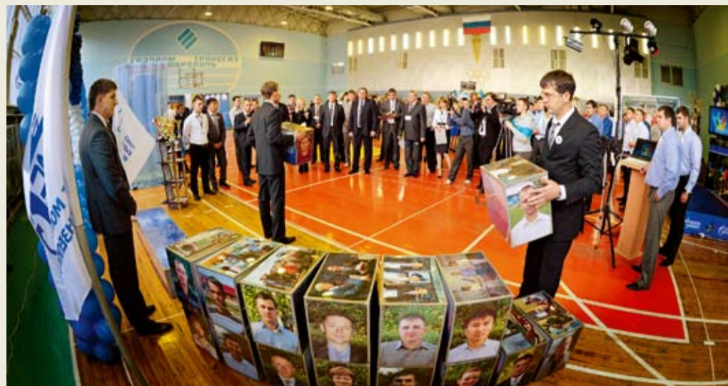
Выступают молодые работники Зензелинского филиала

ция компрессорных станций», «Эксплуатация МГ. Технический отдел», «Связь. Информационные управляющие системы. ПДС. Бухгалтерия», «Метрология. Экология», «Энергетика», «Автоматизация производственных процессов. Охрана труда», «Эксплуатация ГРС. Ремонт оборудования», «Защита подземных коммуникаций от коррозии».