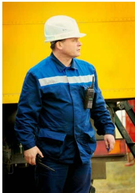
Руководство на объекте