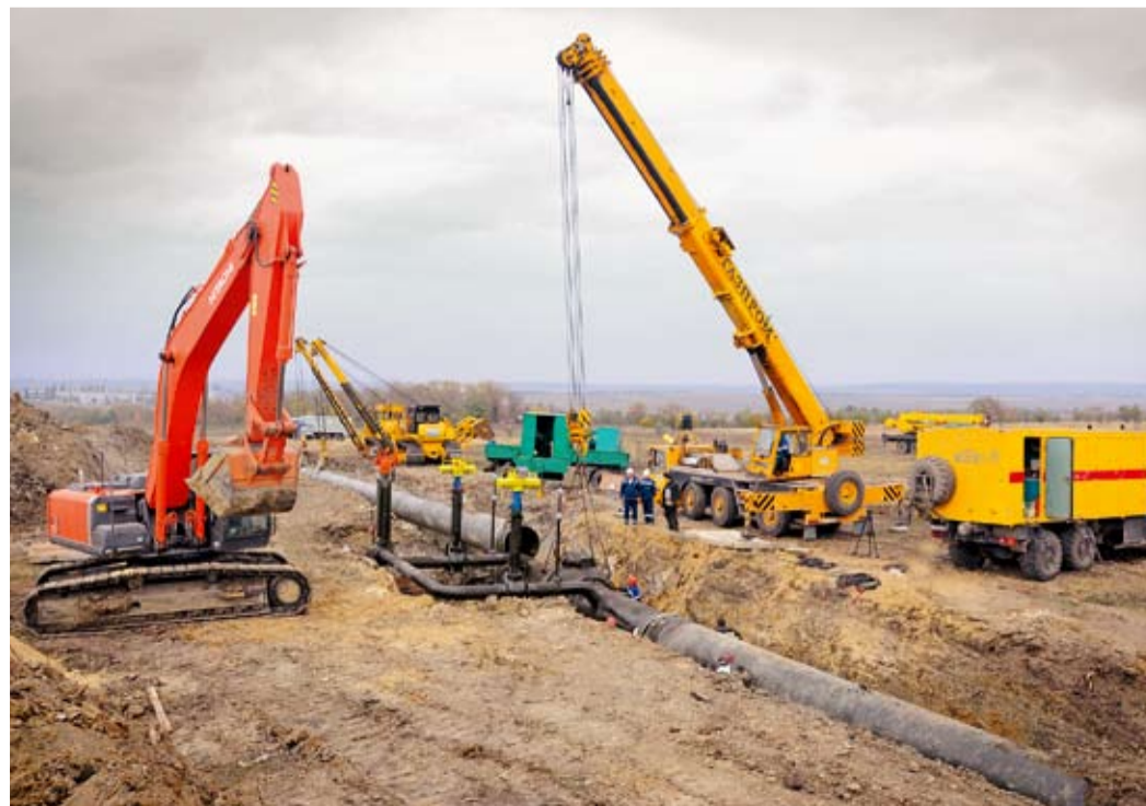
Идет врезка крана