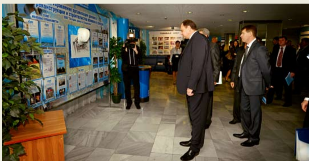
Экспертная комиссия оценивает стенды