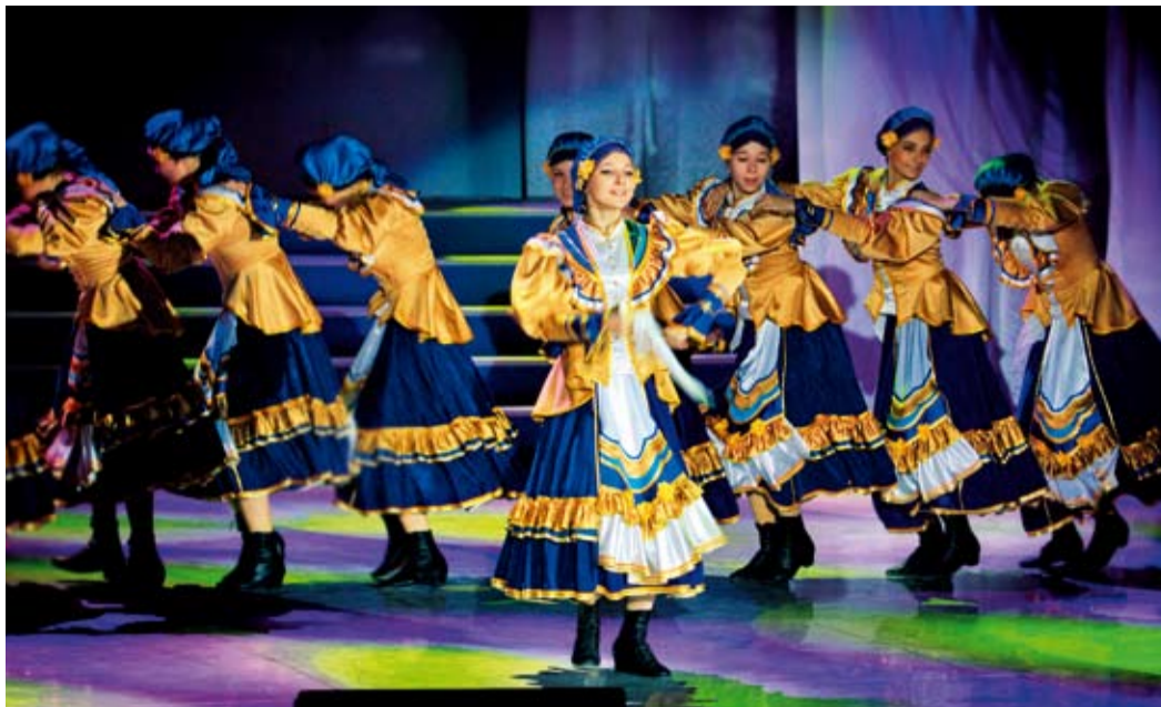
Выступление ансамбля «Задумка»

Сегодня в коллективе занимаются более полусотни детей в четырех возрастных группах: старшей (13–16 лет), средней (11–13 лет), младшей (8–10 лет) и подготовительной (5–7 лет). Младшая и средняя группы занимаются по учебной программе школы искусств с пятилетним сроком обучения, что позволяет им углубленно пройти материал раздела «Основы классического танца», а это отличная возмож-