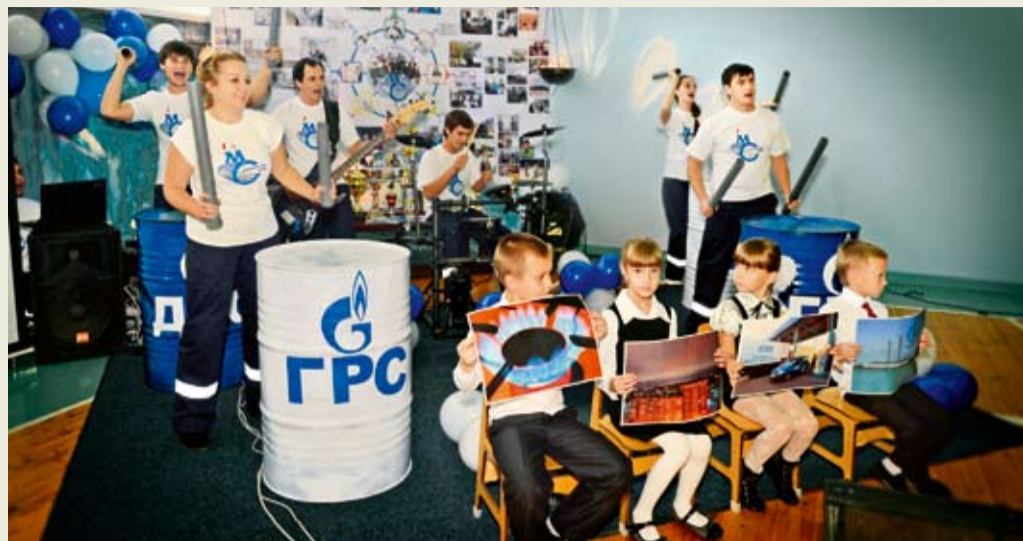
Презентация Совета молодых специалистов Ставропольского ЛПУ МГ

Во Дворце культуры и спорта ООО «Газпром трансгаз Ставрополь» прошла IX научно-практическая конференция молодых работников «Актуальные проблемы работы газотранспортных предприятий в современных условиях». На ней было заслушано более 300 докладов по актуальным проблемам производства. Работа конференции проходила по восьми секциям: «Эксплуата-