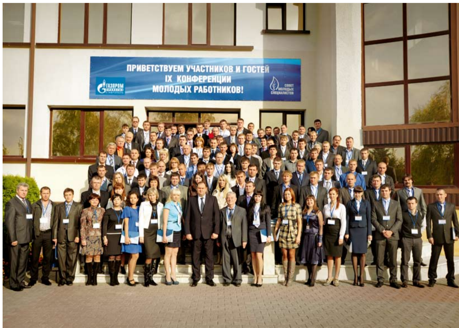
Участники и гости IX научно-практической конференции молодых работников Общества