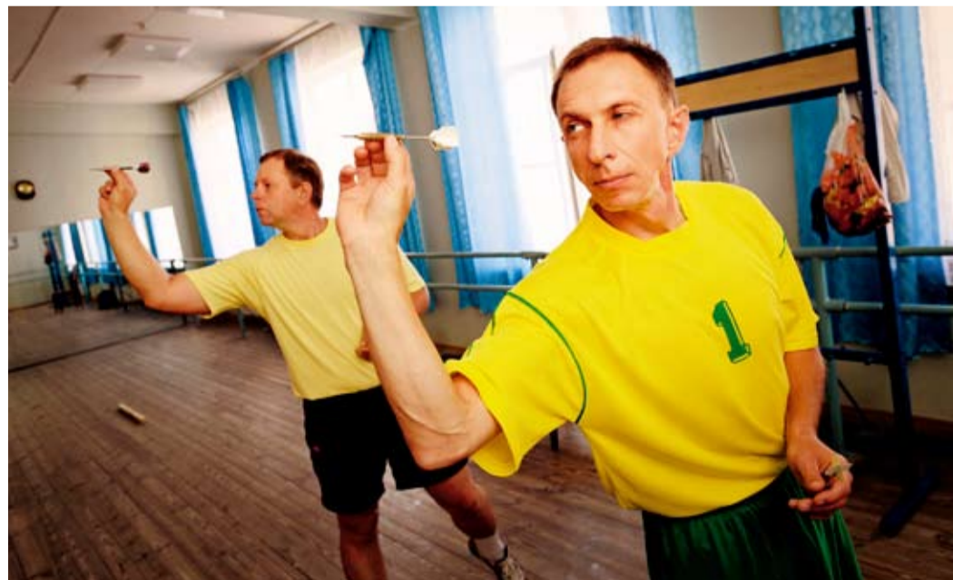
Победители турнира по дартсу – спортсмены ЦМПИ