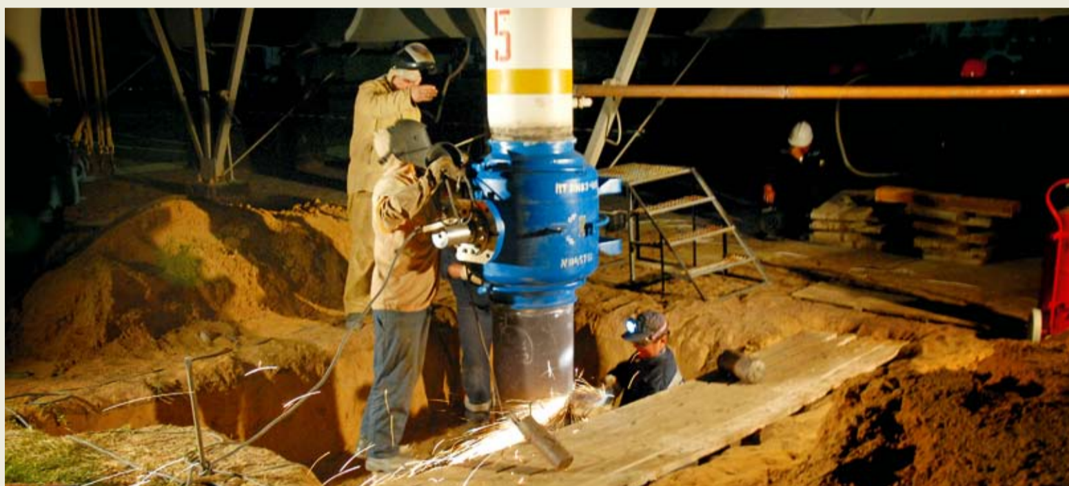
Монтаж крана на аппарате воздушного охлаждения газа КС «Зензели»