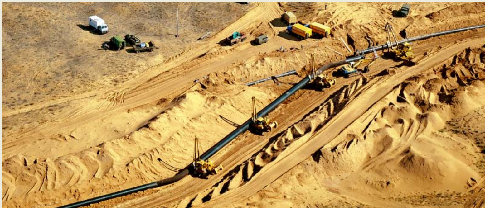
Подключение отремонтированного участка МГ «Магат – Северный Кавказ»

Общества. На участке газопровода с 584-го по 588-й км проведена врезка после капремонта нового участка, на 555-м км – заменили свечную обвязку кранов, а на 401-м км на магистральную трубу смонтирован 58-метровый защитный кожух. На станциях заменили несколько кранов и дефектную запорную арматуру.