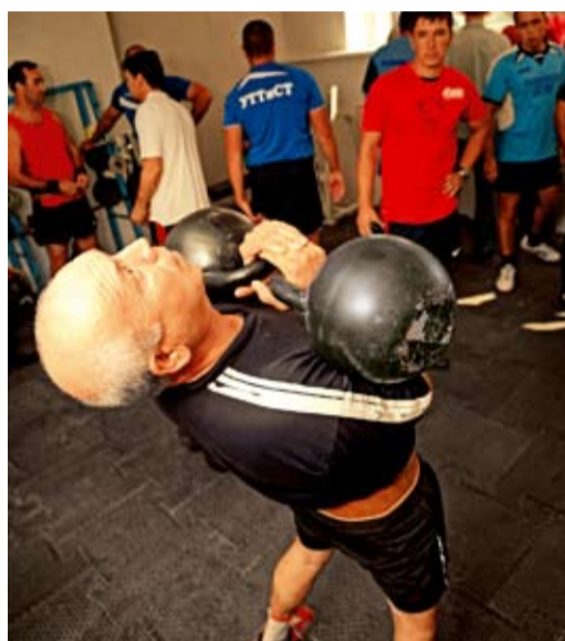
Турнир по гиревому спорту