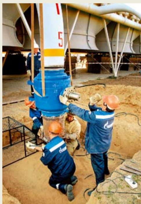
Подготовка к работам по замене крана