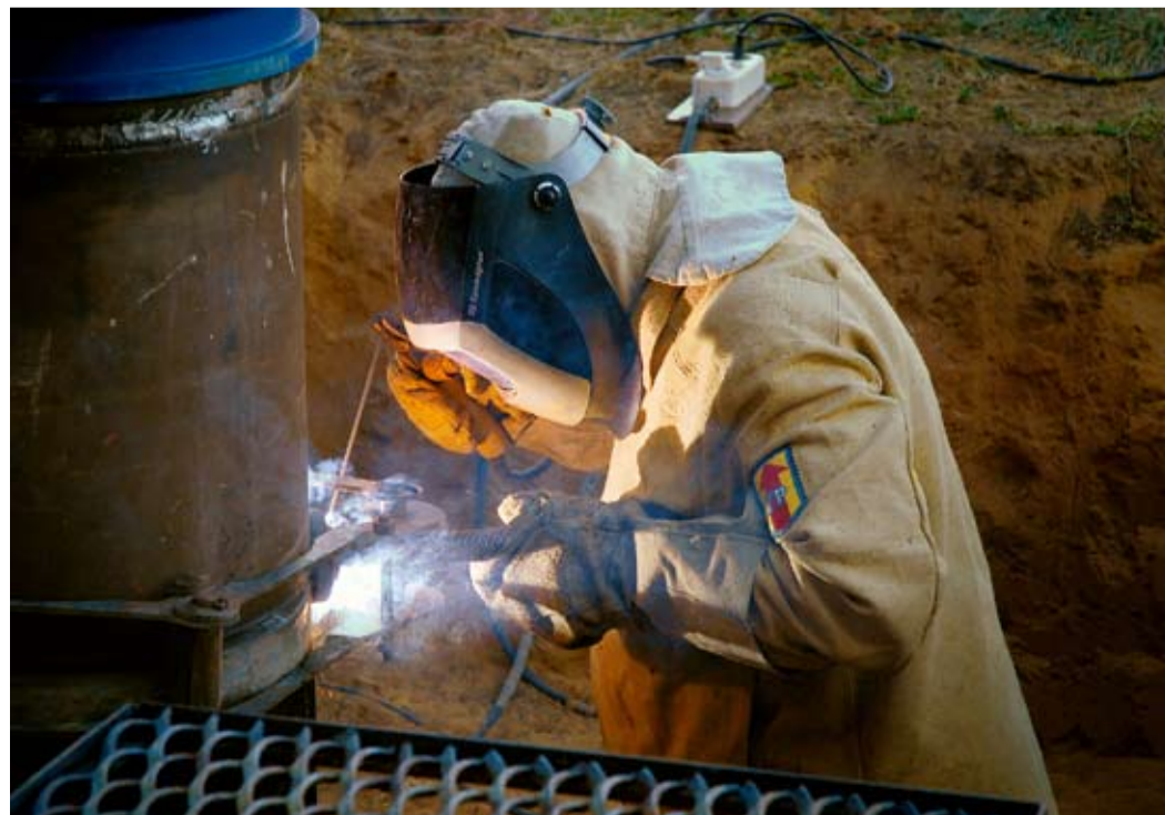
Замена запорной арматуры на КС «Зензели»