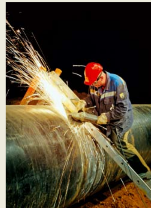
Работы на МГ «Магат – Северный Кавказ»