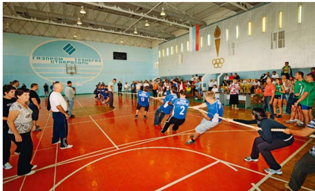
Самый зрелищный вид состязаний – перетягивание каната