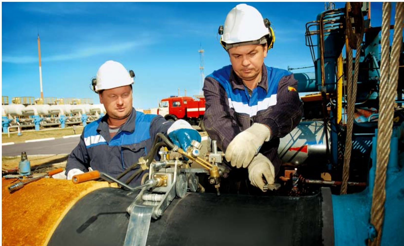
Замена запорной арматуры на компрессорной станции «Замьяны»