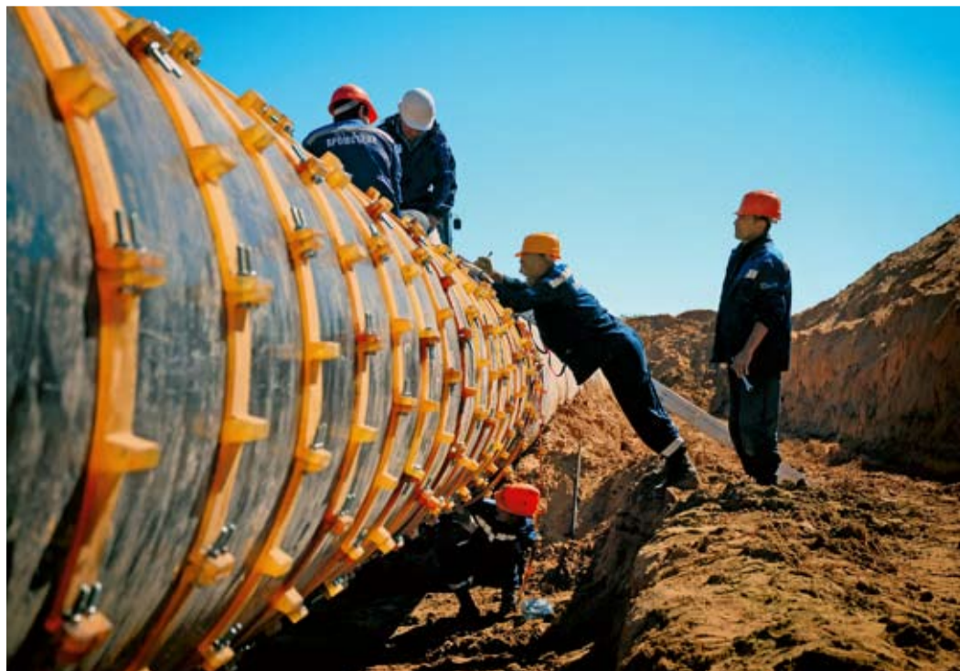
Монтаж защитного кожуха на МГ «Макат – Северный Кавказ»