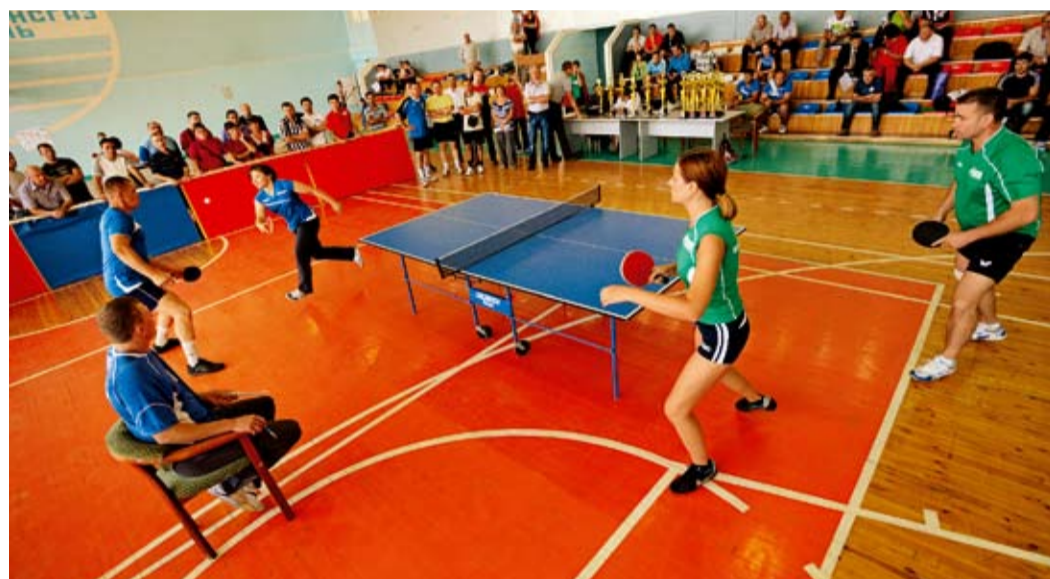
Соревнования по настольному теннису