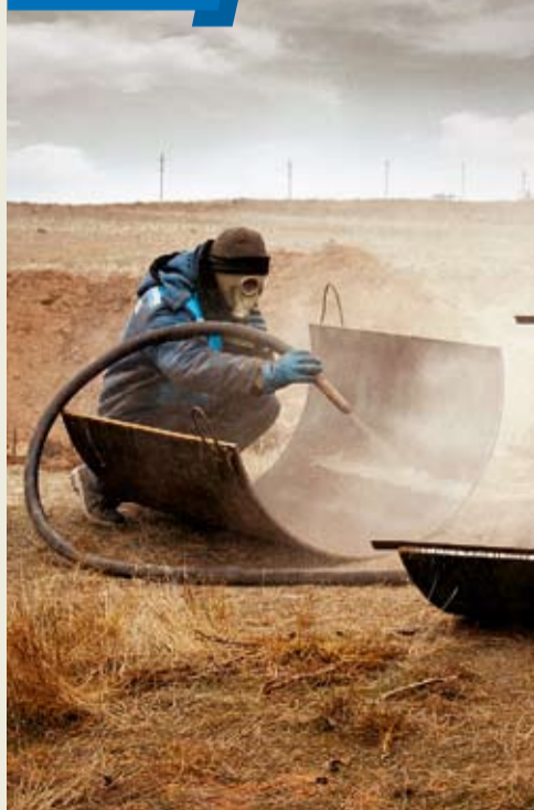
На МГ «АГПЗ – Камыш-Бурун» были проведены ремонтные работы дефектных мест, выявленных по результатам внутритрубной дефектоскопии.

Впервые в нашем Обществе была применена новая технология ремонта методом установки стальных муфт