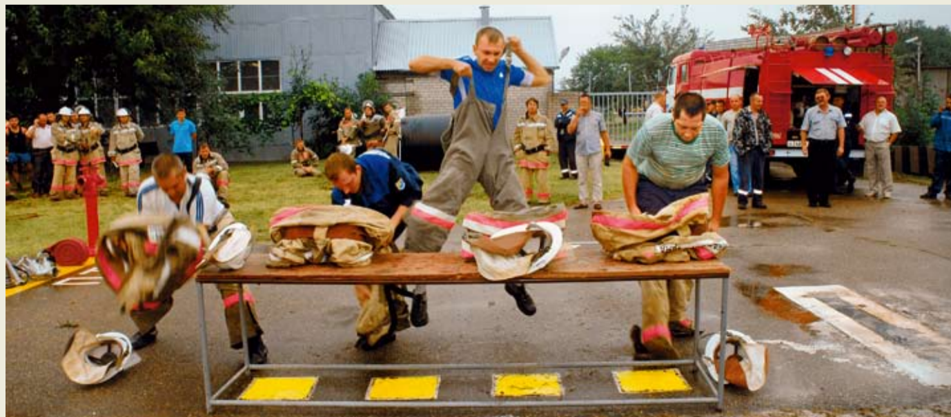
Надевание боевой одежды