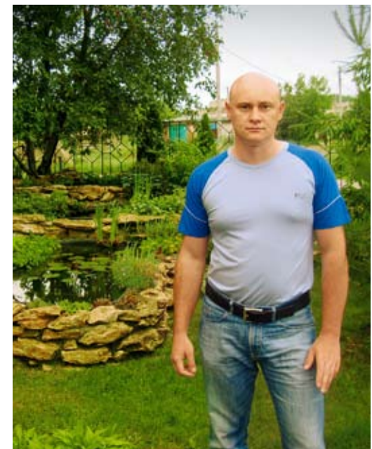
У рукотворного водоема