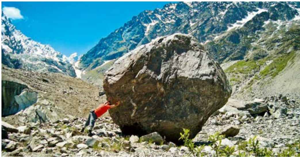
У основания ледника Цей

Каждый, приезжающий в ущелье, обязательно посещает древние памятники – святилища Майрам и Реком (13 век). Дорога к ним идет по берегу реки Цейдон. От нижнего моста – между турбазой «Осетия» и лагерем СКГМИ – видно табличку на дереве и проторенную тропу. Тропа идет по красивому сме-