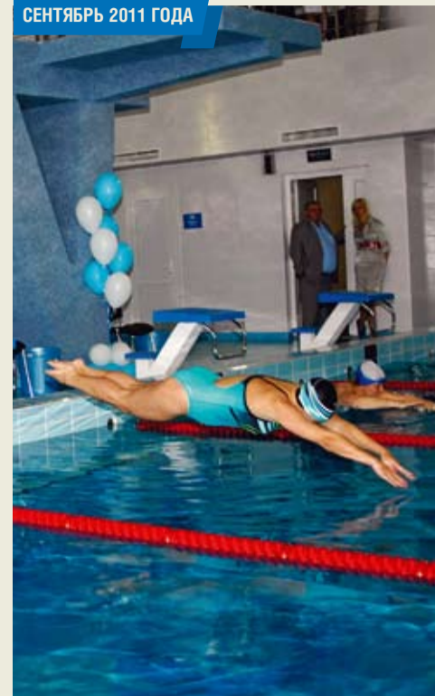
В поселке Рыздвяном введен в эксплуатацию современный физкультурно-оздоровительный комплекс