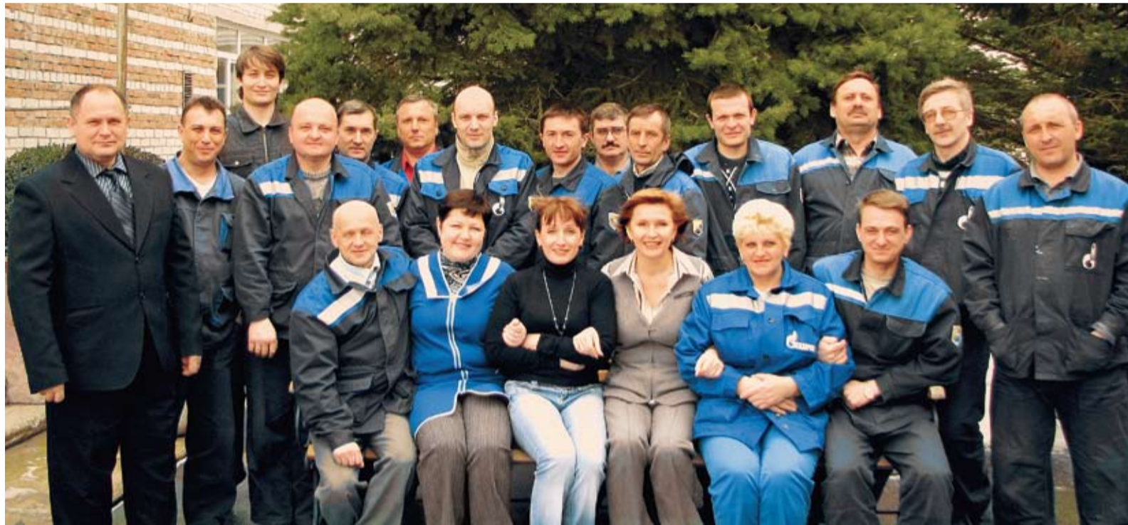
Служба связи Невинномысского ЛПУ МГ