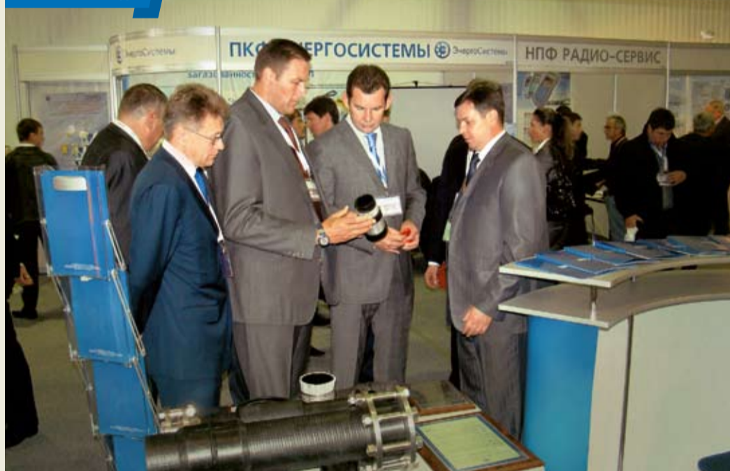
ООО «Газпром трансгаз Ставрополь» награждено дипломом первой степени на Международной специализированной выставке газового и теплоэнергетического оборудования «GAS RUSSIA – KRASNODAR 2011». Престижную награду Общество получило за создание и использование инновационных технологий металлопластиковых труб и шлангов в транспорте газа. «Газпром трансгаз Ставрополь» также отмечено почетной грамотой за поддержку и сотрудничество