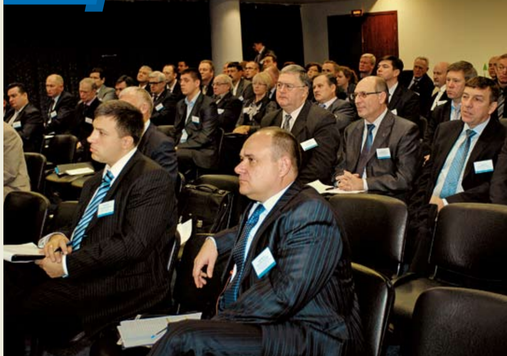
В Кисловодске состоялось отраслевое совещание по итогам разработки и внедрения новых видов энергетического оборудования и технологий на объектах ОАО «Газпром» в 2011 году. На базе ООО «Газпром трансгаз Ставрополь» собрались около 80 специалистов со всей страны – главных энергетиков, представителей проектных институтов и фирм-производителей. На совещании рассматривались и вопросы, касающиеся научно-технического совета ОАО «Газпром» секции «Энергетика»