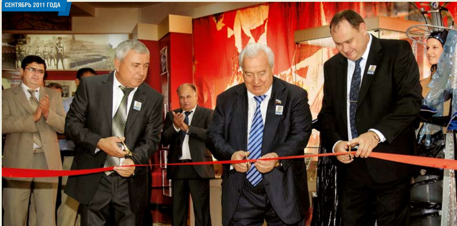
Во Дворце культуры и спорта открыт музей истории Ставропольского ЛПУ МГ. Материалы для него накапливались с 70-х годов XX века, со времен Ставропольского газопромыслового управления. Выделенное для музея просторное помещение наполнено множеством интересных экспонатов, документов, материалов, выразительных фотографий