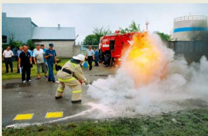
Тушение очага пожара