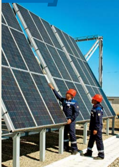
На ГЭС «ГРЭС Ставропольская» Изобильненского ЛПУ МГ впервые в истории ОАО «Газпром» прошли приемные испытания головного образца блочно-комплектного устройства электроснабжения с применением солнечных модулей