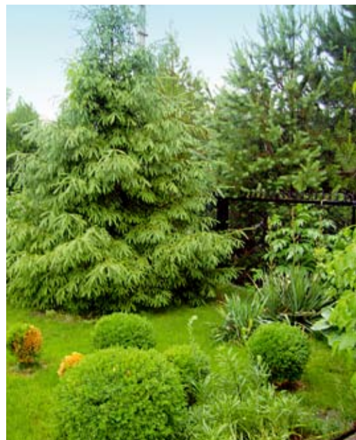
Элемент ландшафтного дизайна