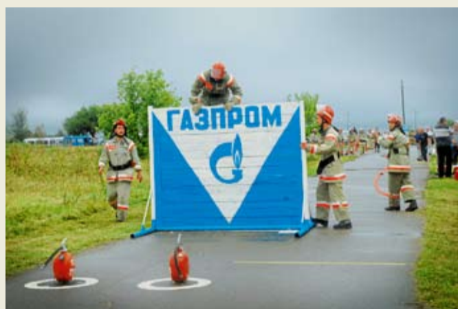
Преодоление полосы препятствий

развертывание с установкой пожарной колонки на гидрант и подачей воды. В итоге зрелищных состязаний первое место заняла команда УОРРиСОФ, второе – Георгиевского ЛПУ МГ, третье – УТТИСТ.