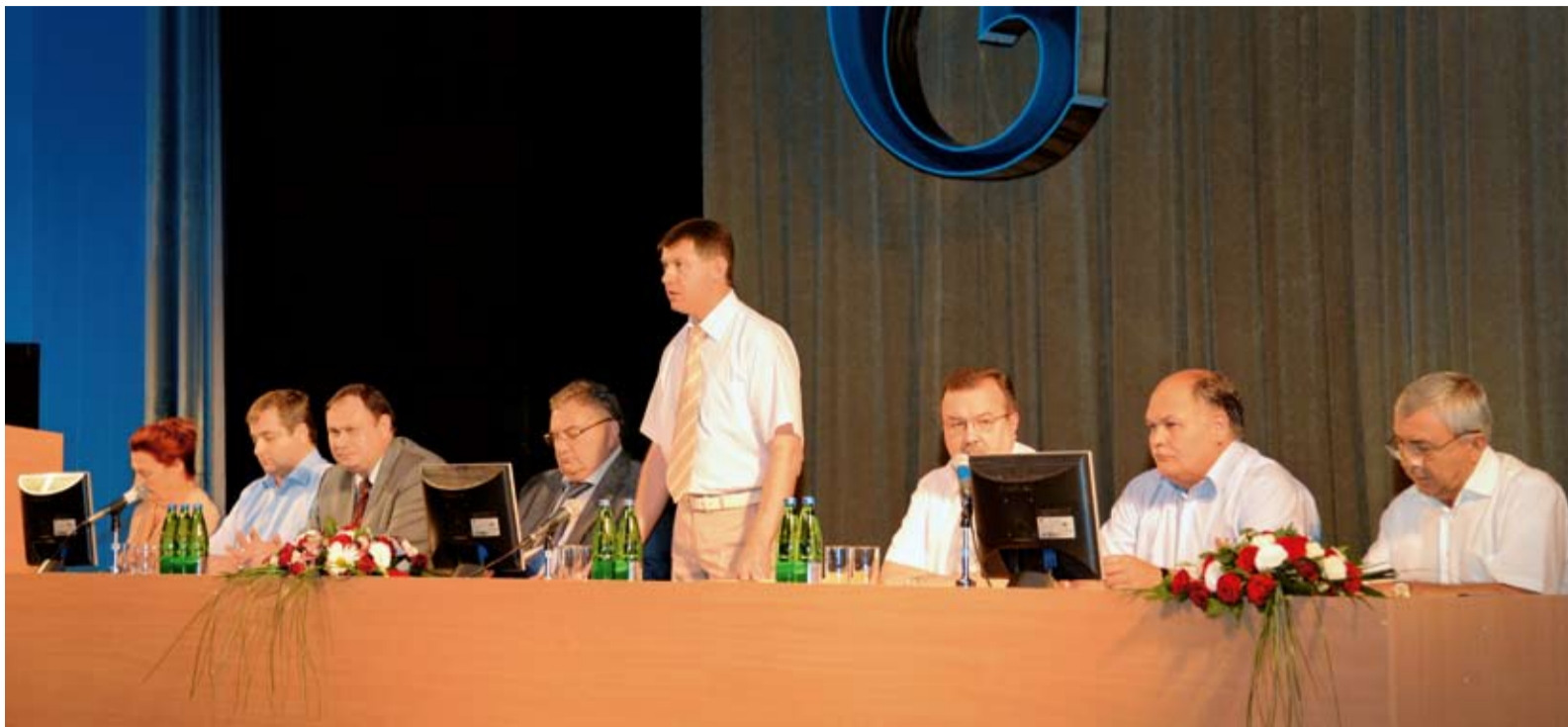
Президиум конференции трудового коллектива ООО «Газпром трансгаз Ставрополь»

Общество целенаправленно совершенствует кадровую политику в соответствии с Политикой управления человеческими ресурсами ОАО «Газпром». Пристальное внимание уделяется повышению квалификации специалистов. В первом полугодии прошли обучение две тысячи рабочих и специалистов. На первом плане, безусловно, социальная поддержка работников и их семей. Колдоговор предусматривает льготное медицинское обеспечение работников и пенсионеров, санаторное лечение, помощь ветеранам войны и молодым семьям, развитие спорта, творческого потенциала работников. Серьезное внимание