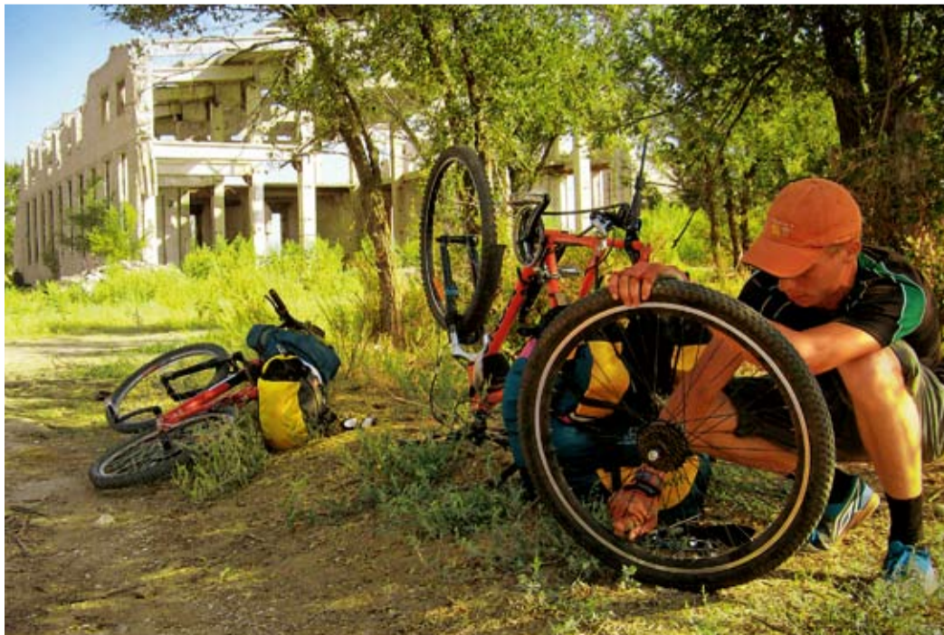
По дороге в Волгоград