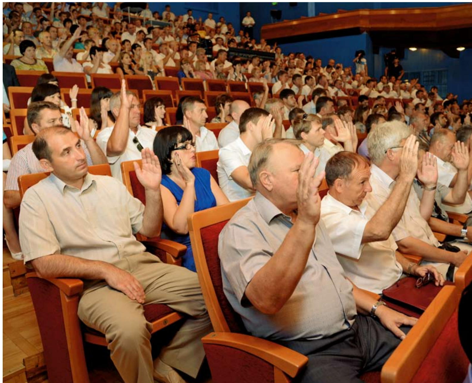
На конференции трудового коллектива ООО «Газпром трансгаз Ставрополь»