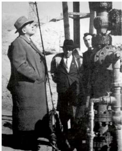
Введение нового оборудования

Николай ХРЕНКОВ, Журнал «Газпром», № 5, 2012 г.