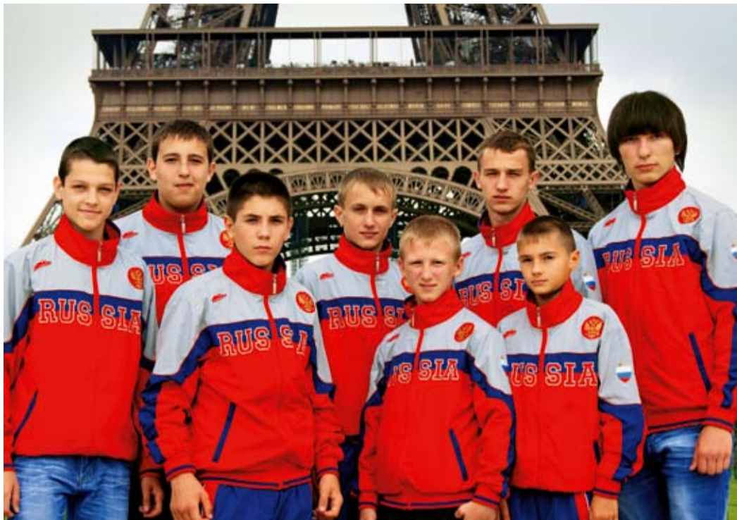
Каратисты Общества на первенстве Европы в Париже