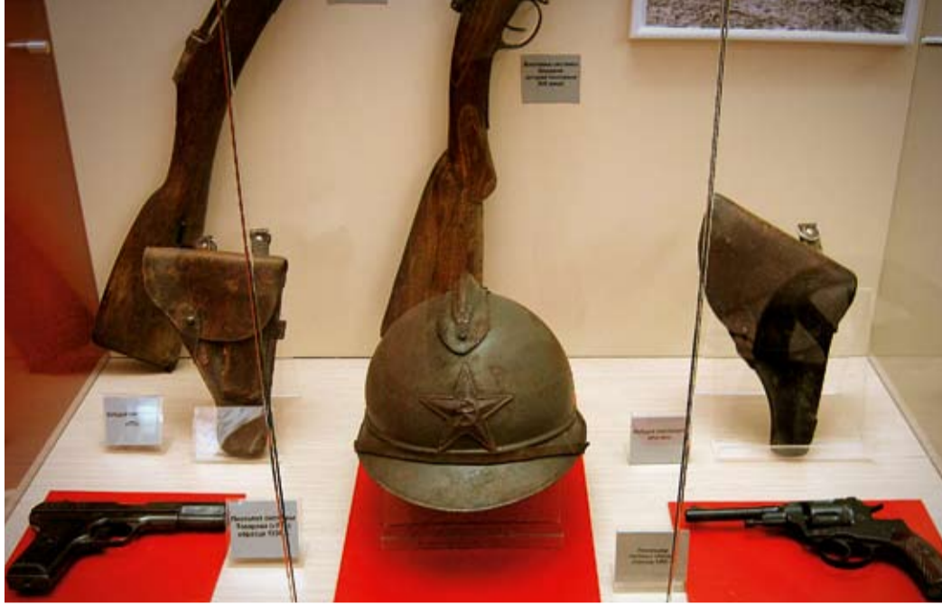
В музее Победы в Великой Отечественной войне 1941-1945 годов Ставропольского ЛПУ МГ

В музее Победы в Великой Отечественной войне 1941-1945 годов Ставропольского ЛПУ МГ недавно появился новый экспонат. Это каска Адриана М-17 образца 1917 года, разработанная генералом французской армии Огюстом Луи Адрианом в 1915 году.