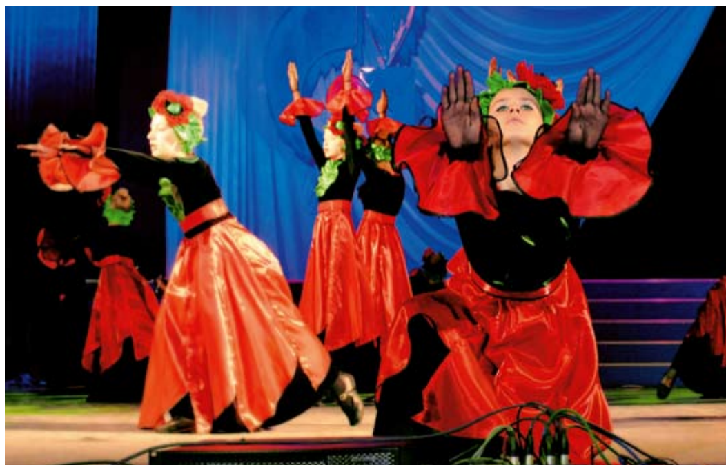
Хореографический ансамбль «Задумка»