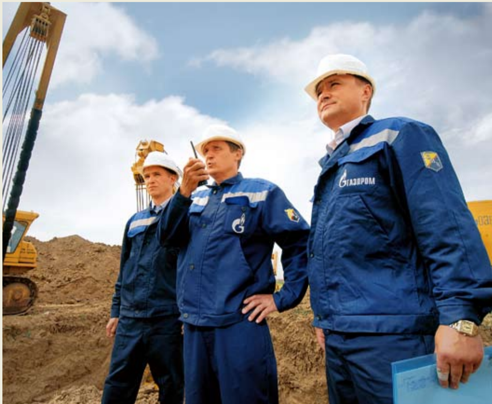
Руководство огневыми работами