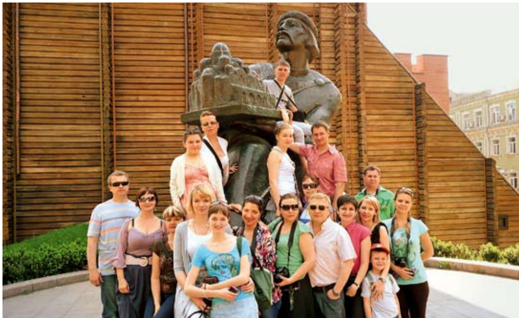
Газовики у памятника князю Ярославу Мудрому

Во всем своем великолепии пред нами предстал Андреевский собор, возведенный в сере-