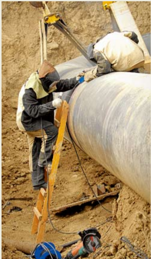
Заполнение сварного шва

В Привольненском ЛПУ МГ прошли комплексные огневые работы по замене участков технологических трубопроводов с отводами и соединительными деталями трубопроводов перед кранами Д, 1200 узла подключения КС-5 «Привольное». Привольненцам помогли специалисты и техника УАВР. Всего на объекте трудились 27 человек. Ремонт выполнялся по инициативе и под методическим руководством производственного отдела по эксплуатации КС администрации Общества. Работы прошли в штатном режиме и с должным качеством, о чем свидетельствует заключение специалистов ЛККСиД Невинномысского ЛПУ МГ.