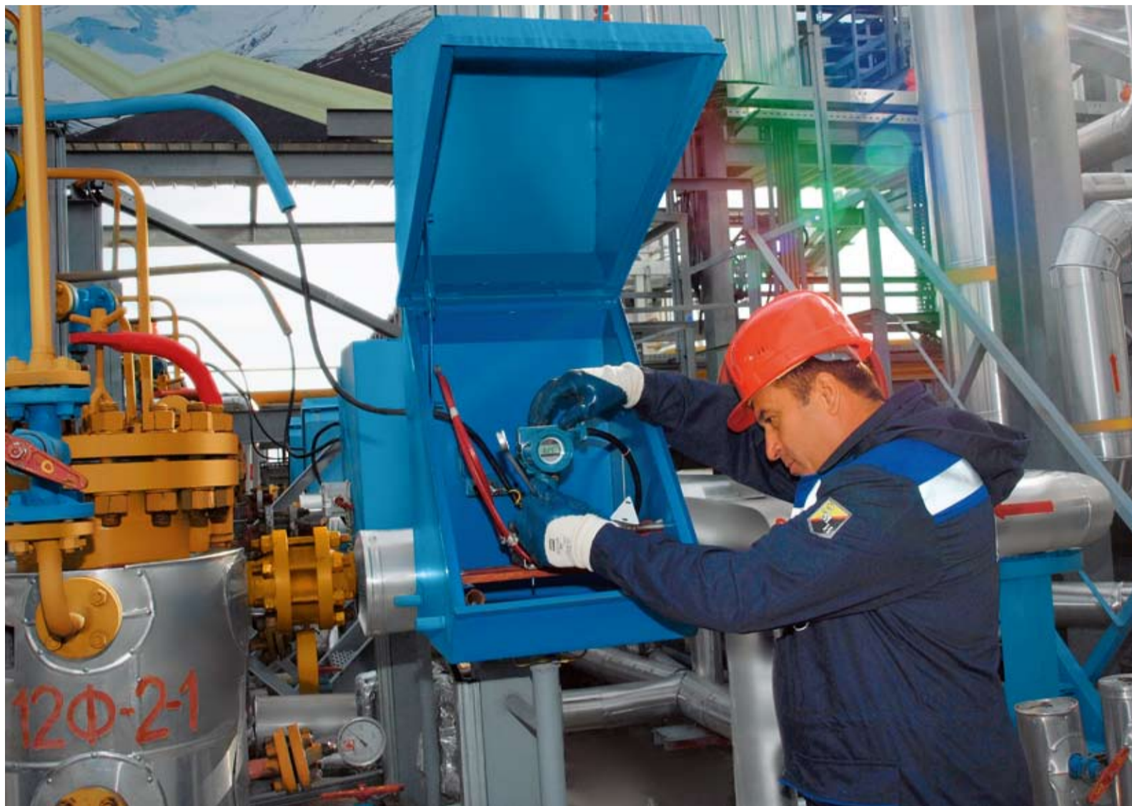
Техническое обслуживание и снятие показаний с преобразователя давления «МЕТРАН» в цехе осушки газа Алагирского РЭП Моздокского ЛПУ МГ