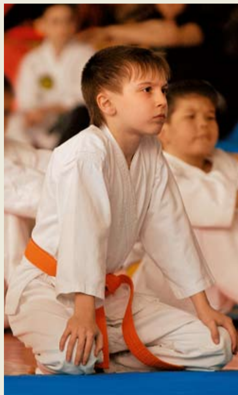
В ожидании боя