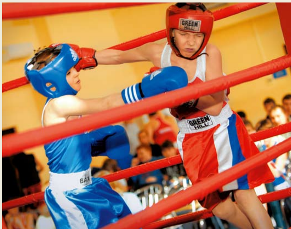
На первенстве по боксу