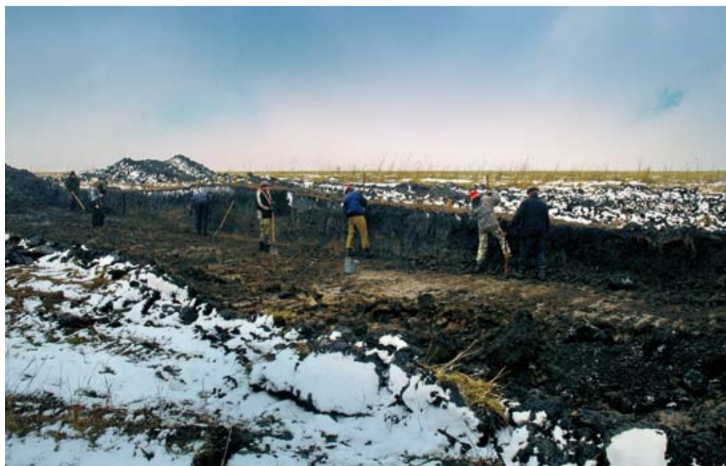
Курган в процессе раскопок