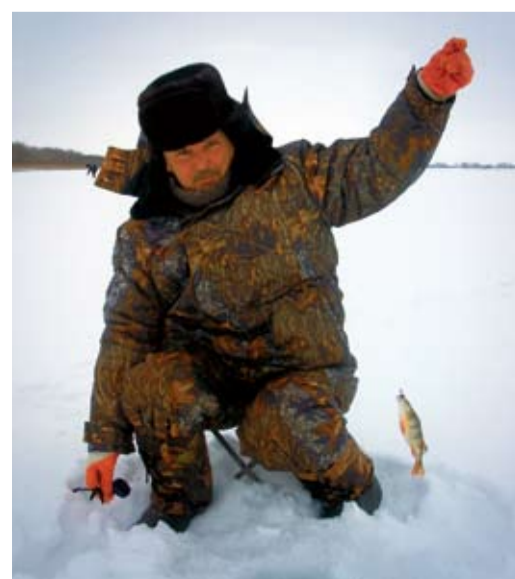
Вот так улов!