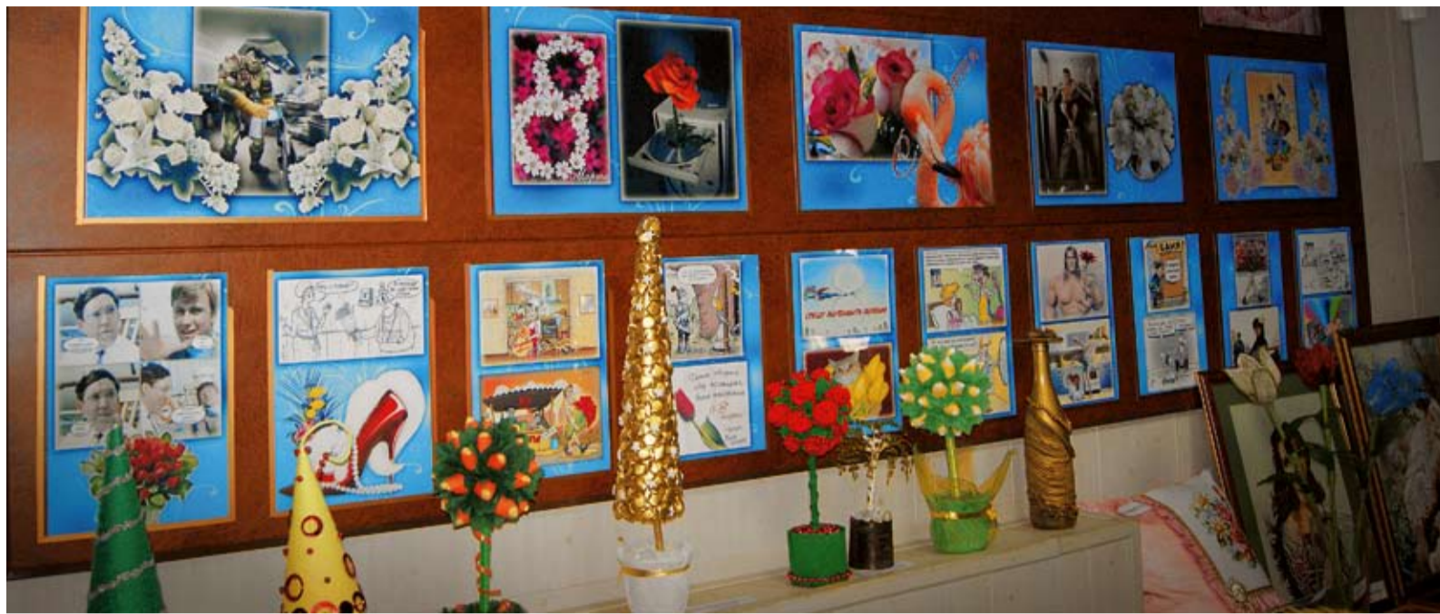
Выставка женского мастерства в Зензелинском ЛПУ МГ