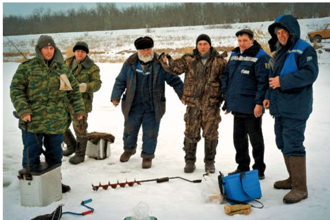
Рыбалка на реке Калалы