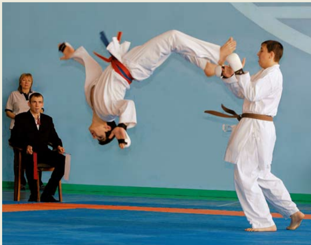
«Рывок» к победе