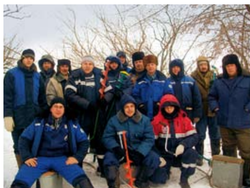
Участники зимней рыбалки