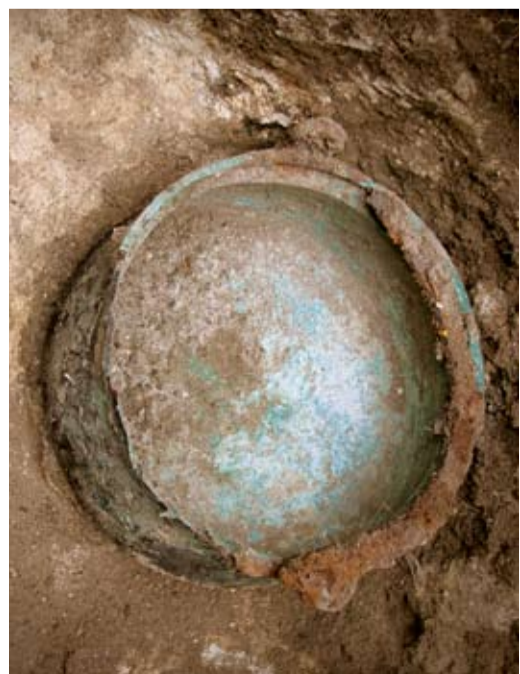
В погребении древнего кочевника (XIII-XIV вв. н.э.)