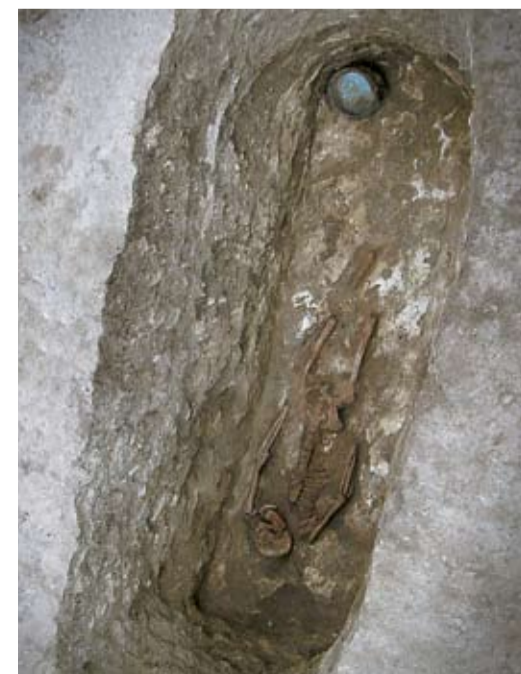
Погребение древнего кочевника (XIII-XIV вв. н.э.)