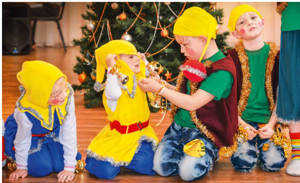
Детский дом, УАВР

Молодежь администрации Общества по давно уже проторенной дорожке отправилась поздравлять своих давних и хороших друзей. Первым по маршруту следования стал смешанный детский дом № 13 села Надежда.