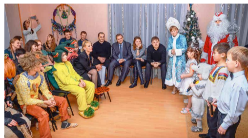
Детский дом села Надежда