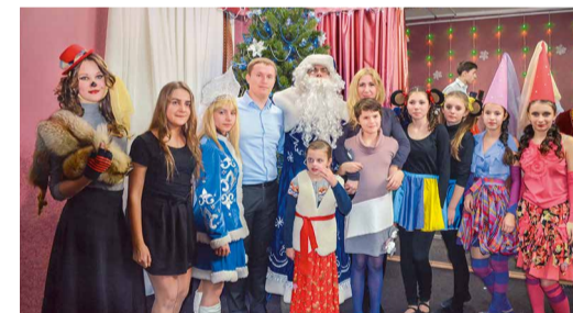
Детский дом, ИТЦ

Совет молодых специалистов Привольненского ЛПУМГ вместе с профсоюзной организацией филиала поздравили с наступающим Новым годом ребят из детского дома с. Преградного. Газовики приобрели сладкие подарки и вручили воспитанникам