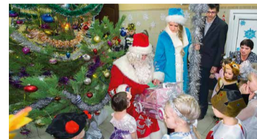
Детский дом, Изобильненское ЛПУМГ

Работники Изобильненского ЛПУМГ организовали для ребят из детского реабилитационного центра с. Тищенко праздничный утренник. Малыши выступали с различными миниатюрами и читали стихотворения. Дети написали письма Деду Морозу, в которых просили подарки не только для себя, но и оставляли пожелания счастья другим. Исполнить их новогодние мечты помогли сотрудники Изобильненского филиала. Среди подарков были куклы, машинки, конструкторы и даже огромный игрушечный белый медведь.