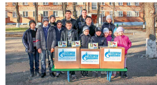
Поездка в интернат, Светлоградское ЛПУМГ

квитанции о подписке на несколько детских печатных изданий. Ранее работники филиала участвовали в благотворительной акции «Дерево добра» и на собранные средства оформили подписку на газеты и журналы для детворы.