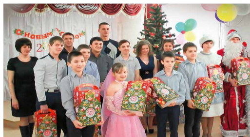
Детский дом, Светлоградское ЛПУМГ

Отгремели фейерверками и хлопками открытых бутылок шампанского новогодние праздники. Работники нашего Общества не только отмечали сами, но и традиционно поздравляли воспитанников детских домов, интернатов и других казенных государственных учреждений. О том, как это было, мы расскажем в этом итоговом материале.